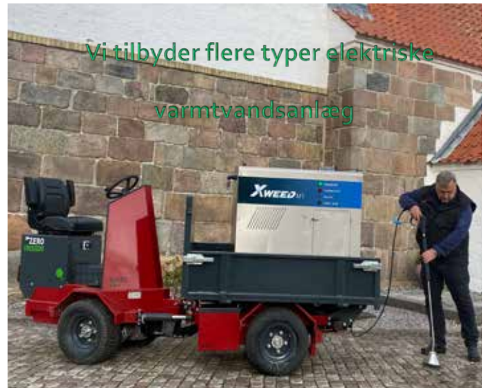
Vi tilbyder flere typer elektriske varmtvandsanlæg