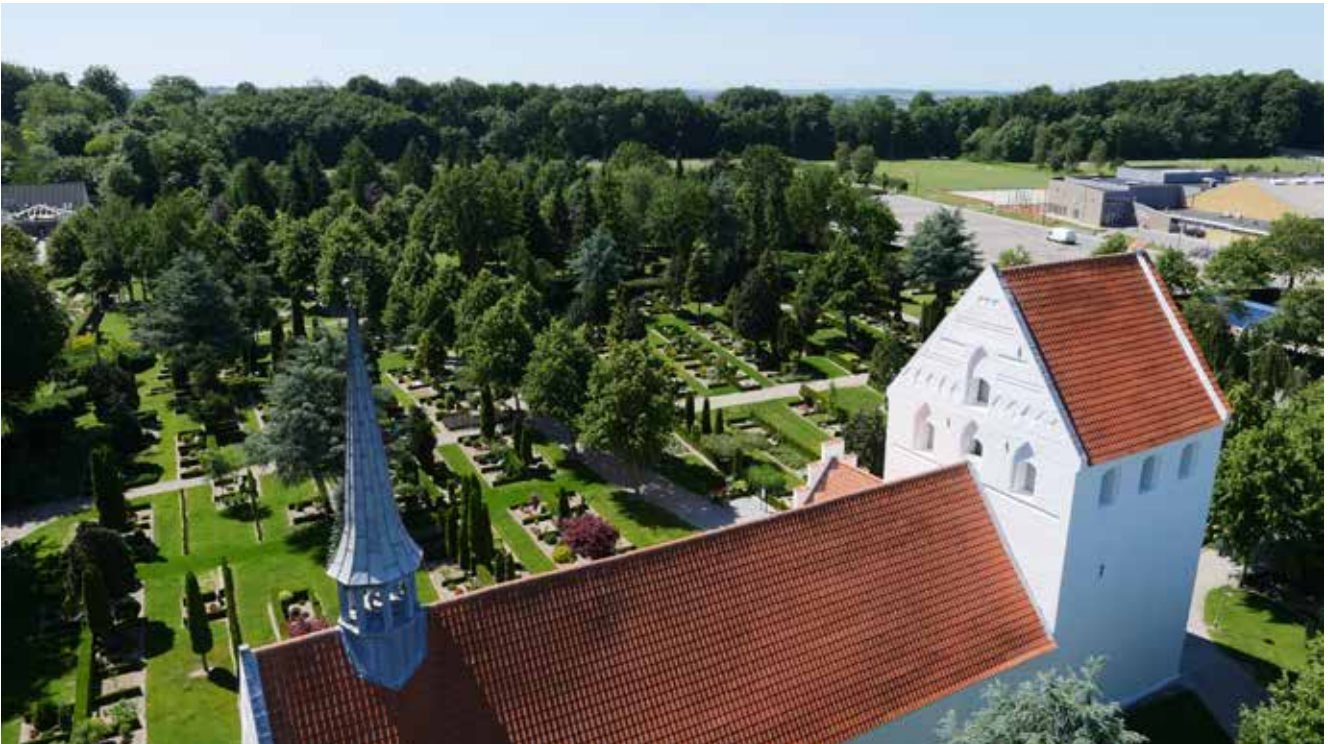
Vissenbjerg Kirkegård har et areal på ca. 3,35 ha.

dende. Jeg måtte lave noget andet, og efter et par omveje til blandt andet Arla, endte jeg som gravermedhjælper i Glamsbjerg og Køng på Fyn. Under barslen med mit andet barn kunne jeg dog mærke, at jeg savnede noget administrativt i mit arbejde, så jeg overvejede faktisk at få job inde for kontorverden, men endte som souschef på Assens-Gamtofte Kirkegård, hvor jeg for alvor fik smag for at arbejde med kirkegårdsdrift og ledelse.