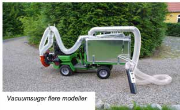
Vacuumsuger flere modeller