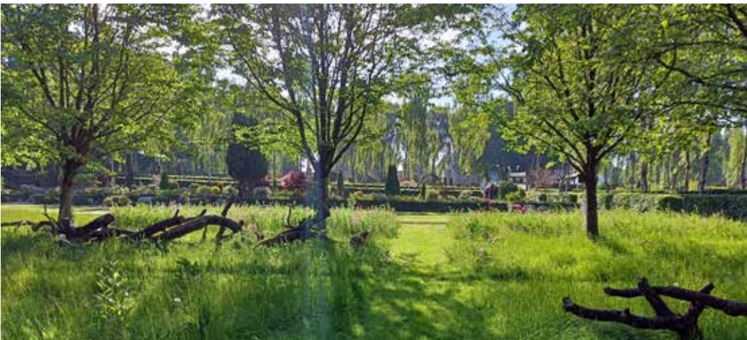
Insekthoteller behøver ikke at stamme fra det lokale byggemarked

til at vi lukker naturen ind - eller snarere - giver mere plads til den natur, som vi allerede har, på og omkring den ellers velplejede kirkegård. Jeg har fået rigtig mange henvendelser om, hvorfor områder ser forsømte ud. De fleste er enige i at det med biodiversitet er rigtig godt, MEN hvorfor skal det lige være her hvor jeg bor og så lige på kirkegården?