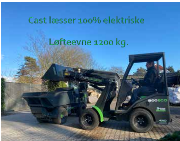
Cast læsser 100% elektriske Løfteevne 1200 kg.