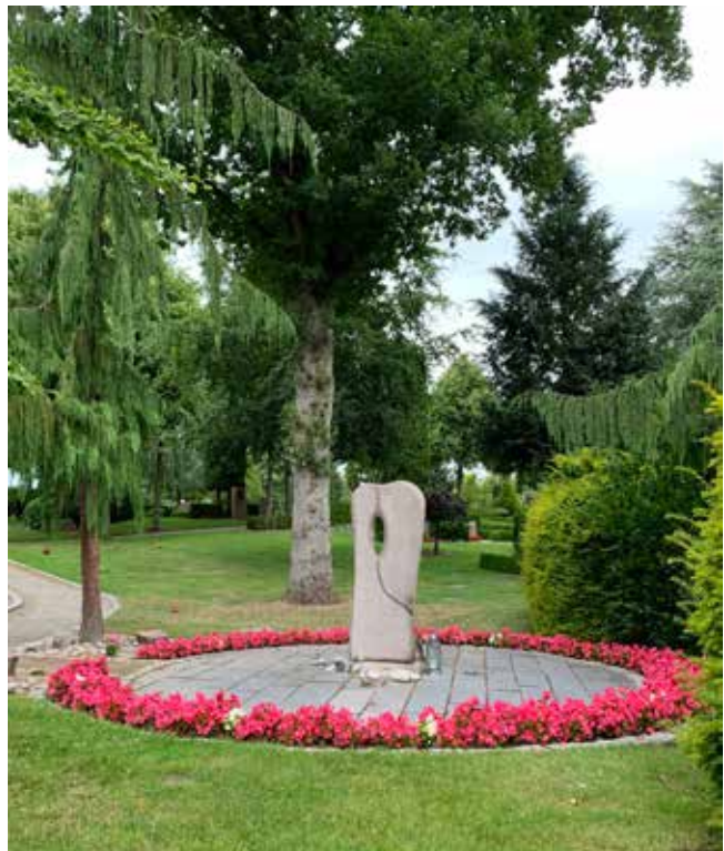
Den anonyme fællesgrav.

"Det er mit ønske, at kirkegården ikke skal fremstå øde, men som et levende sted som folk i høj grad bruger mens de er i livet."