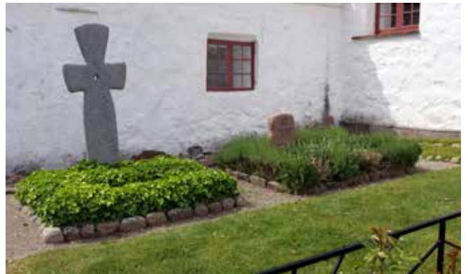
Bregninge Kirkegård.