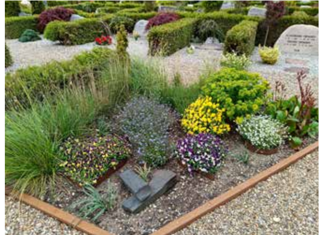
Kirkegårdens egne anlæg kan være med til at inspirere til grønnere gravsteder.