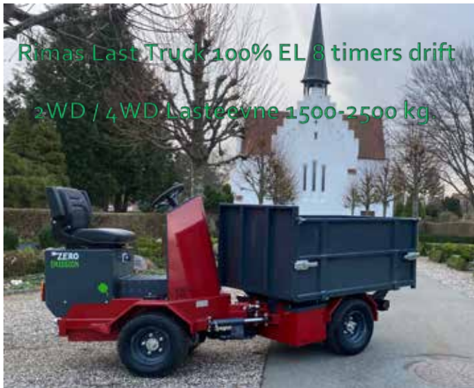
Rimas Last Truck 100% EL 8 timers drift 2WD / 4WD Lasteevne 1500-2500 kg.