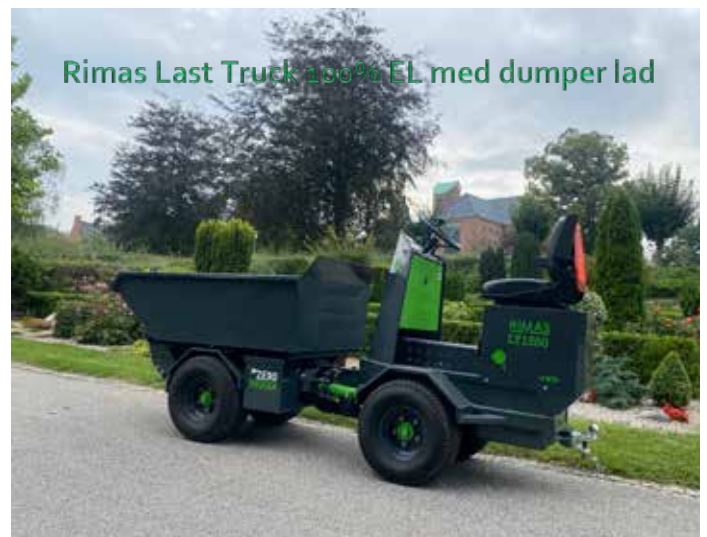
Rimas Last Truck 100% EL med dumper lad