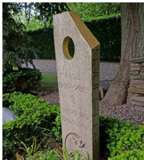
Ærøskøbing Kirkegård.