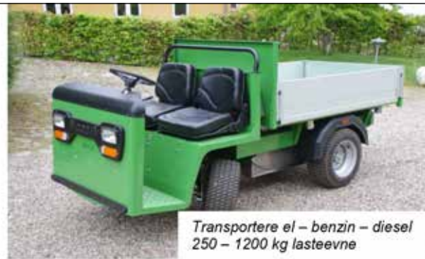
Transportere el – benzin – diesel 250 – 1200 kg lasteevne