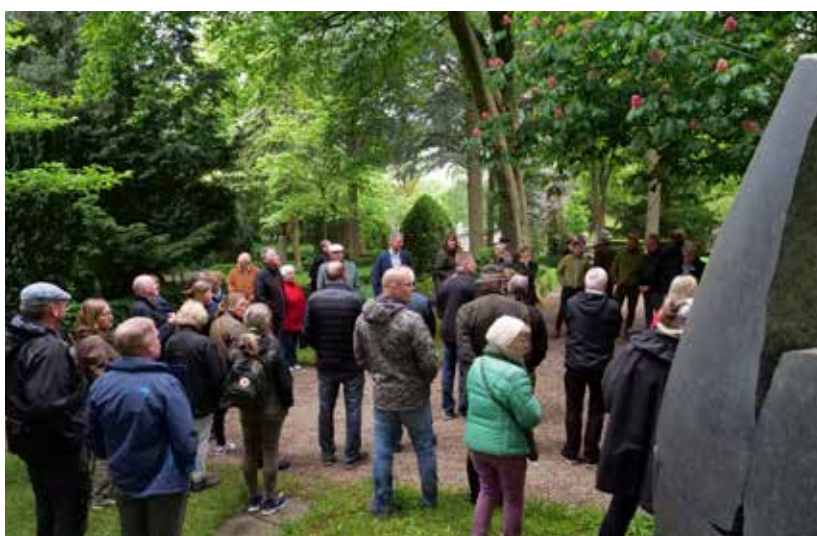
Svendborg Assistens Kirkegård.